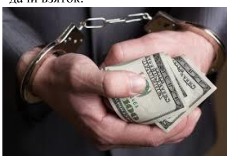
Следует отметить существенное увеличение средней суммы незаконно передаваемого денежного вознаграждения с 6 000 до 103 000 руб.

К уголовной ответственности за совершение преступлений коррупционной направленности в 2015 году привлечено 171 лицо, при этом большая часть — по фактам дачи взяток.